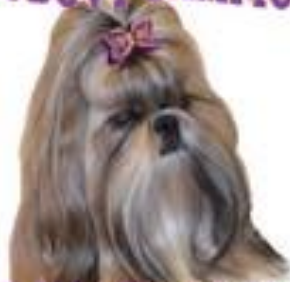
RED WHITE BEAUTY Z KOJCA COLI