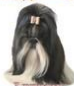
LEWISIE MORAVIA CLÉR