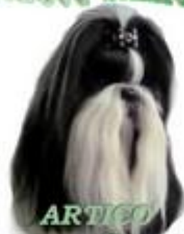
ARTICO DANETTA GODDESS