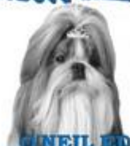
O'NEIL ED SYLVADOG BOHEMIA